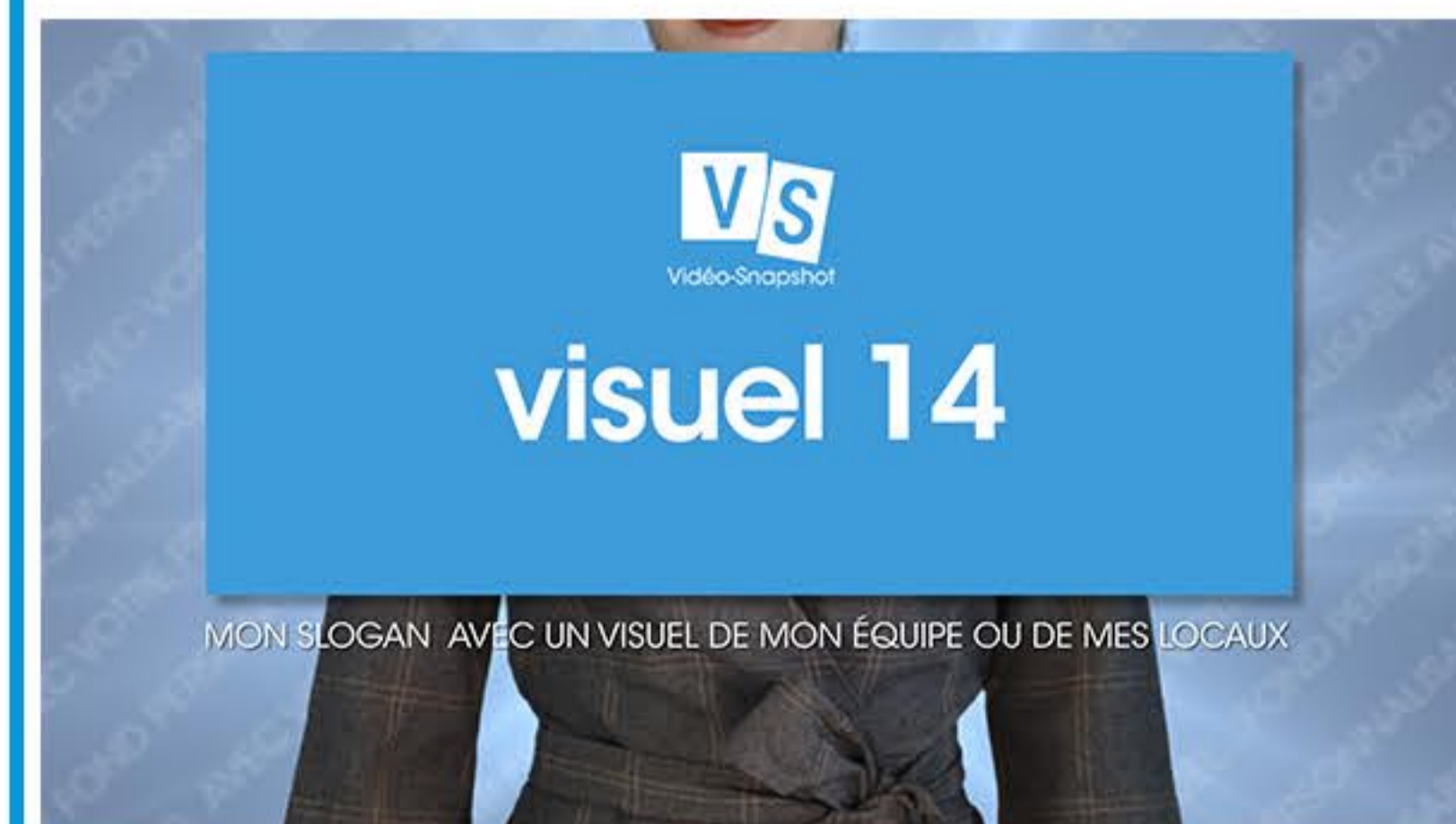
Plan 5 - votre slogan ou baseline Une accroche de 60 caractères maximum*