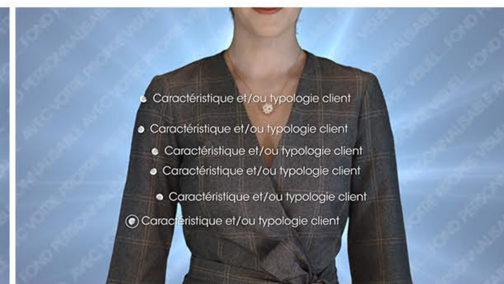
Plan 2 - vos cibles et/ou vos forces 6 textes de 40 caractères maximum*