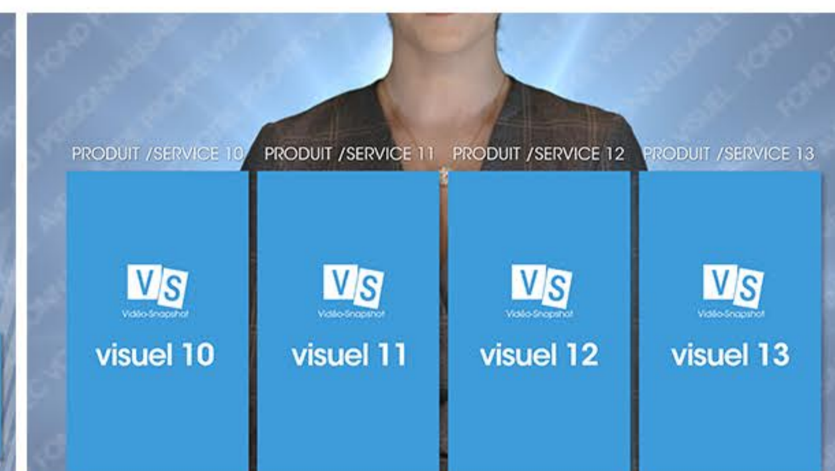
Plan 4 - vos produits - services ou typologie client 4 textes de 40 caractères maximum*