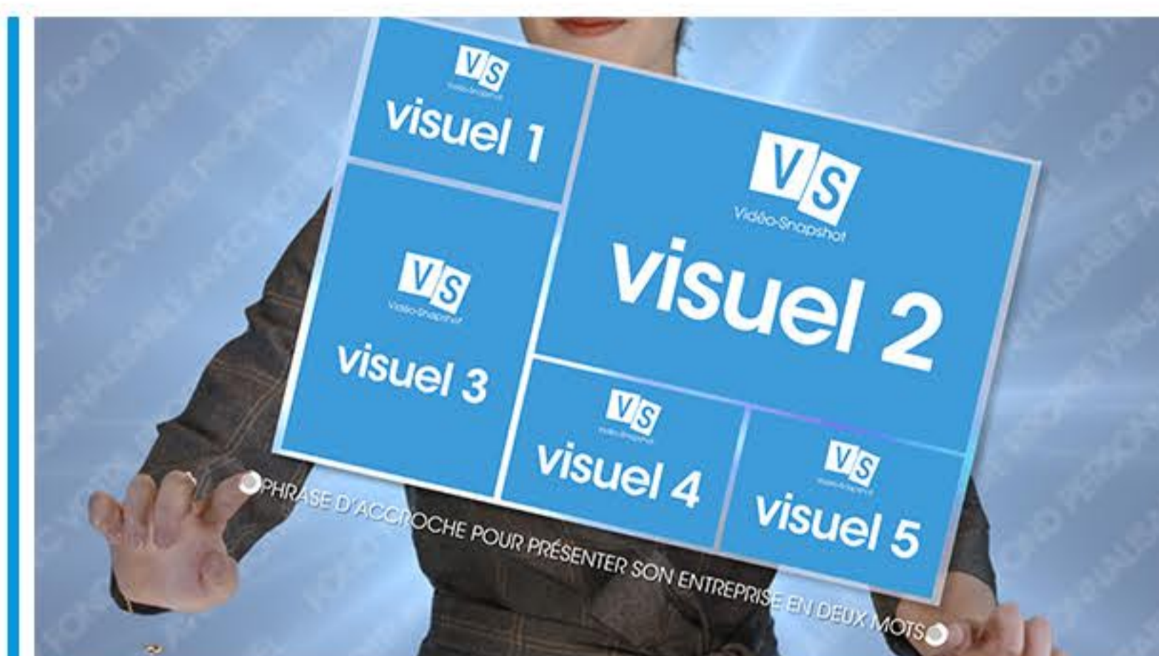
Plan 1 - présentation de votre activité une phrase de 60 caractères maximum*