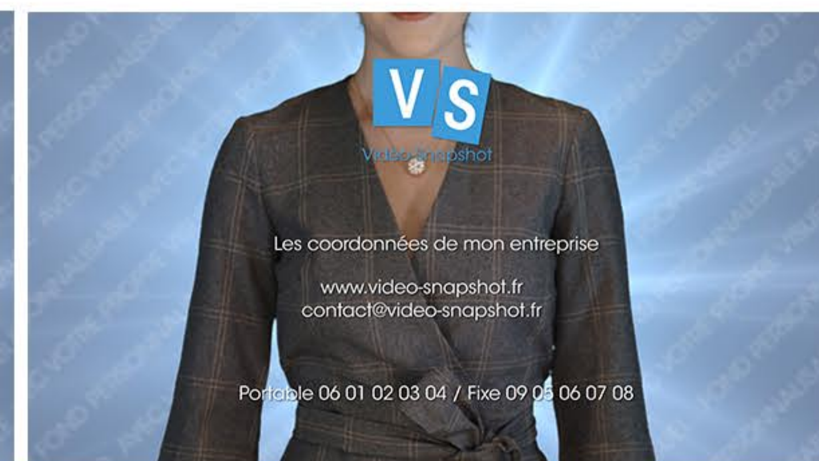
Plan 6 - vos coordonnées complètes 4 lignes maximum